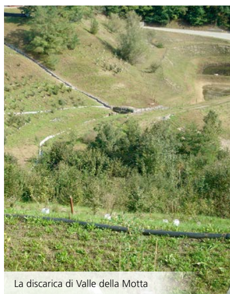
La discarica di Valle della Motta

La squadra ISS Servizio Canalizzazioni, su richiesta dell'ACR (Azienda Cantonale dei Rifiuti) si è occupata della manutenzione delle canalizzazioni e delle vasche di trattamento del percolato presso due discariche: